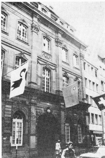
Municipalidad de Basilea.

El día siguiente los miembros de las distintas comisiones se encuentran trabajando nuevamente y debaten acerca de los derechos políticos, el seguro por enfermedad, la información, las escuelas suizas en el extranjero, los derechos de nacionalidad y el ordenamiento de los problemas administrativos, mientras que felices suizos del extranjero se dedican a descu-