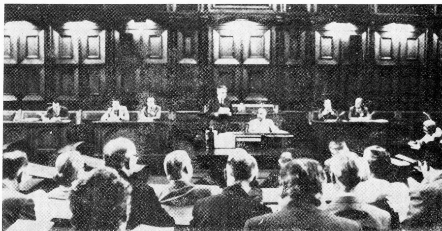
Sesión de la Comisión de suizos del extranjero.