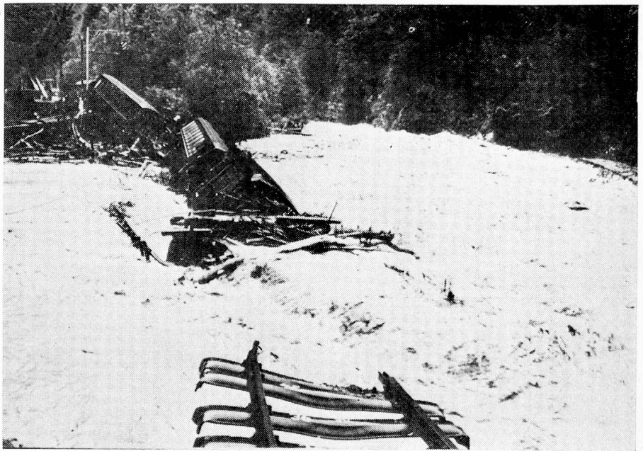
Accidente ferroviario cerca de Davos.

El Comité de iniciativa de Berthoud deposita en Berna su ini-