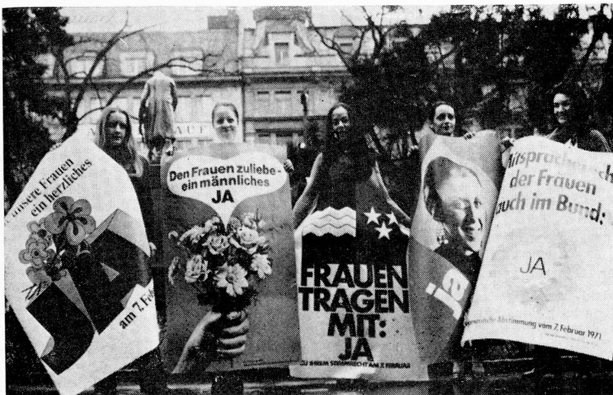
Encantadoras embajadoras de los derechos políticos de la mujer

Algo más debe considerarse. En un proceso evolutivo de alcances mundiales, la sociedad se está re-estructurando en sociedad industrial. La mis-