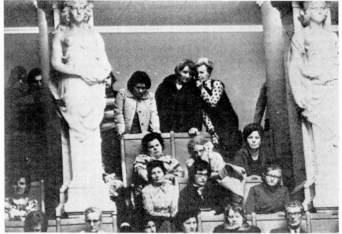
Oyentes en el Consejo Nacional

hay Directoras de Museos. Hasta hace unos años una mujer se encontraba al frente de un Zoológico. Dos mujeres integran el Consejo Científico Suizo y una el Consejo Médico Federal.