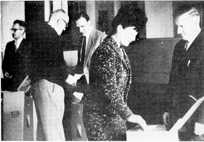
Emitiendo el voto