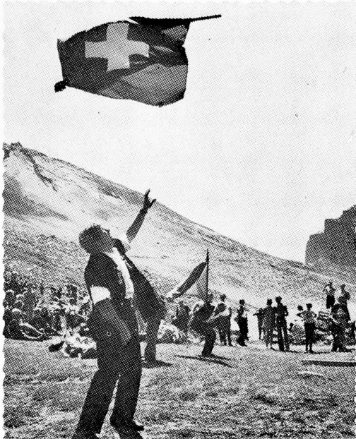
Greetings from Switzerland.