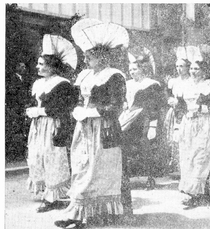
Mujeres de Appenzell con sus vestidos domingueros

El país de Appenzell es rico en tradiciones populares, tales como el de los "Silvesterkläuse" en la trastierra (Urnäsch- Herisau), en que alegres y bullangueras comparsas deambulan, disfrazadas con inmensos sombreros y máscaras y portando