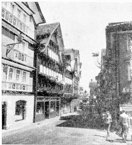
Calle principal en Appenzell

dades productivas. La buena evolución económica de los últimos veinte años ha modificado naturalmente —como en toda Suiza— la fisonomía de las aldeas y del paisaje, y no siempre en sentido favorable. A pesar de ello, un visitante extranjero encontrará que el paisaje de Appenzell ha conservado su encanto particular. El hecho de que la gran prosperidad económica no pudo desbordarse aquí, se debe probablemente a la situación geográfica desventajosa de esta región, en relación con las grandes rutas de comunicación. Así como los romanos no incluyeron la región del Sántis en su red de tránsito, tampoco los pioneros de las comunicaciones modernas juzgaron favorable la situación y no es por nada que el cantón de Appenzell ha quedado como único cantón que no posee un solo metro de vía de los ferrocarriles federales como tampoco un solo metro de carretera nacional. Esta situación poco privilegiada ha impuesto al cantón considerables cargas en materia de ferrocarriles privados, sólo recientemente aliviadas con la cooperación de los cantones vecinos y de la Confederación. Que el cantón no estuviera atravesado por los grandes ramales de tránsito y pese a ellos se encuentre próximo a los mismos no deja de ser una ventaja para los turistas que hoy día buscan las regiones apacibles como las