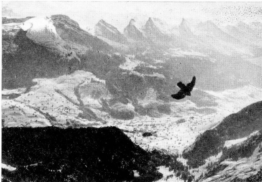
Vista al Toggenburg y las Churfirsten desde el Säntis.

Durante los siglos siguientes las gentes de Appenzell fueron súbditos de los abades Saint Gallenses, teniendo que oblar fuertes contribuciones al monasterio. En 1400, estimulados por el movimiento de liberación de los cantones centrales, se desembarazaron, en un admirable combate, de la dominación St. Gallense (en 1403 y 1405, batallas de "Vögelinsegg" y de "Stoss"). Aunque tampoco los ciudadanos de St. Gall estaban conformes con el Abad, no se llegó empero a constituir un estado St. Gallo-Appenzellense, porque en el momento decisivo los temerosos ciudadanos de la ciudad de St. Gall abandonaron a los de Appenzell, y así estos últimos resolvieron fundar a su propio estado. Esta decisión únicamente se convirtió en realidad porque en el momento oportuno habían concertado una alianza con los estados confederados, firmando pactos en 1411 y 1452, que les aseguraban una posición legal subordinada en la Confederación. Y porque los hombres de Appenzell combatieron valientemente en las guerras lombar-