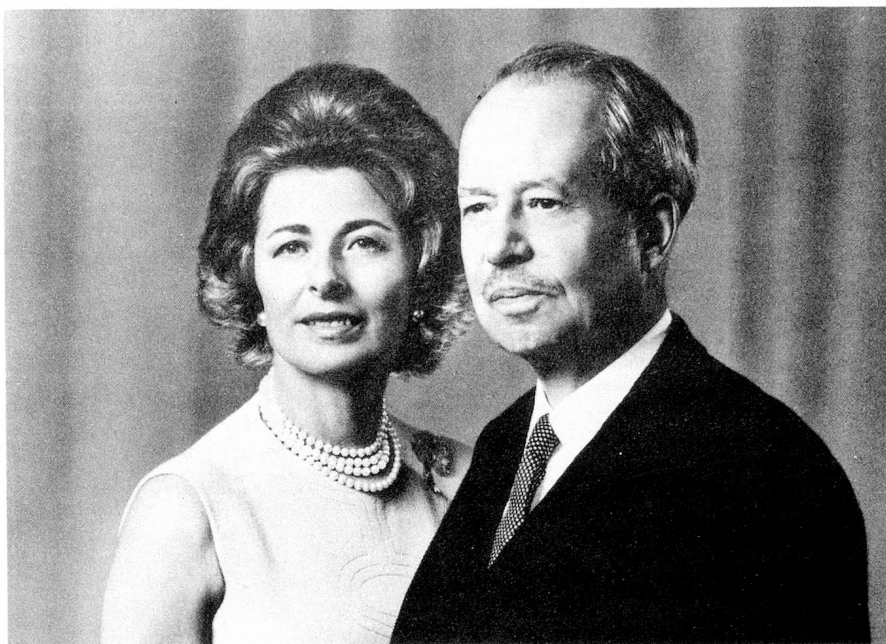
El Príncipe y la Princesa de Liechtenstein

La capacidad imaginativa y la fantasía, inclusive permiten reconocer hoy en el pequeño Estado un modelo para el mundo. Cito al dramaturgo moderno Friedrich Dürrenmatt: «... puedo imaginarme a un escritor, un escritor que con intenso placer es liechtensteinés y solamente liechtensteinés, para quien Liechtenstein, representa mucho más, incomensurablemente más que sólo las 61 millas cuadradas que efectivamente mide. Para este escritor Liechtenstein se convertirá en modelo del mundo, lo idealizará, dilatándolo en su fantasía, haciendo de Vaduz una Babilonia y del Príncipe, por ejemplo, un Nabucodonosor. Los liechtensteineses seguramente protestarán y encontrarán todo muy exagerado, echarán de menos al folklore liechtensteinés y la producción de quesos. Pero este autor