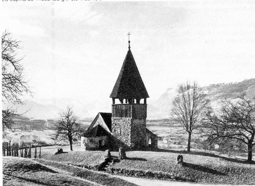
La capilla de Triesenberg

da del sufrimiento, se produjo el delirio de los procesos de hechicería. Solamente en Vaduz fueron quemadas más de 300 brujas. Los sucesores amorales de los grandes Hohenems tuvieron que enajenar los territorios de Vaduz y Schellenberg, limitrofes al Imperio. Entre los numerosos interesados nobles y los conventos de St-Gall y de Weingarten, hizo ofertas también la Casa de Liechtenstein. La nobleza de los Liechtenstein puede seguirse en su evolución desde el siglo 12 y su influencia en la Corte de Viena alcanzó particular apogeo en el siglo 16 y 17. A pesar de los extensos territorios que poseía la Casa, no había entre ellos ninguno limítrofe al Imperio, condición jurisdiccional indispensable para alcanzar asiento y voz en el Consejo de la Corte Imperial. Con ese fin Hans Adam Andreas von Liechtenstein, el príncipe y gran mecenas del arte barroco y talentoso economista, adquirió en 1699 el señorío de Schellenberg lindero con el territorio imperial y en 1712 el condado de Vaduz. En 1719 el emperador Carlos VI reunió a los dos territorios