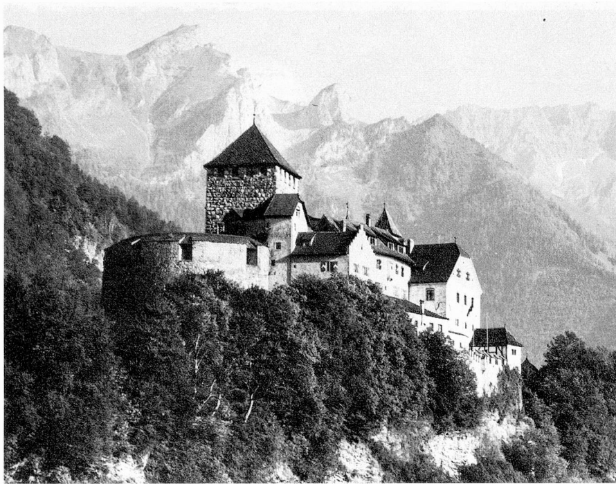
El Castillo de Vaduz

«Lutzengüetle» (alr. de 2700-2500 antes de J.C.) recibió su nombre del lugar de su descubrimiento: Lutzengüetle en la montaña Eschen, e irradió al ámbito noreste suizo. También las culturas subsiguientes como la de Pfyn y la de Horgen dejaron tras de sí, en nuestro territorio, artefactos típicos. Viniendo del oeste y del noroeste, ellas no penetraron más al este. El desarrollo de la Edad de Bronce en el Valle del Rin superior pudo ser establecido con precisión por la investigación. Especialmente durante la época de bronce tardía (alrededor de 1300 a 800 años antes de J.C.) existió en el ámbito central alpestre una vida autónoma claramente identificable, conocida bajo la denominación de cultura «Melauner», cuyas ramificaciones se extendieron a la parte occidental de nuestro territorio. Muy probablemente la antigua Retia, históricamente difícil para definir, coincida con la región dotada de objetos «Melauner». La arqueología puede probar la continuidad de los asentamientos en el