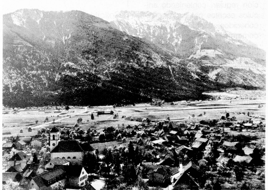
Liechtenstein se distingue por su paisaje variado