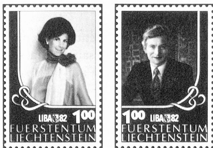
Sellos especiales «LIBA '82»