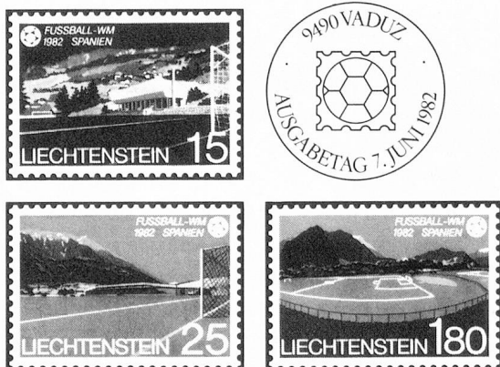
Sellos especiales «Campeonato mundial de football 1982 España»

1982: Valor nominal sólo Fr. 17.70 (8 series con 25 sellos). El valor nominal de una serie anual completa de Liechtenstein cuesta sólo unos 18 francos suizos. No envíe dinero; pero pida hoy mismo nuestras condiciones de compra mediante el cupón de este anuncio.