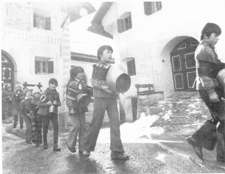
Chalanda-Mars: antigua costumbre de primavera en los Grisones.

deración Helvética no es ningún mito sino un acuerdo concluido entre Estados soberanos por razones prácticas y lógicas. Este origen razonable de la Confederación Suiza tiene consecuencias de vastos alcances en el estilo político de nuestras autoridades, la forma de vida de la población y el clima intelectual que reina de modo general en nuestro país. Hay pocos países en el mundo donde la sociedad se encuentra tan marcada por la diversidad como en el nuestro. En un espacio tan estrechamente limitado existen organizaciones que pretenden ser las únicas competentes en su sector de actividad. Pensemos solamente en las asociaciones de la industria y el comercio, de artes y oficios y de la administración, cuyo número excede las 13.000 en Suiza. La anécdota según la cual en el sitio donde se reúnen tres suizos se constituye de inmediato una nueva asociación, no deja de tener, por lo tanto, una pizca de verdad. Todos estos agrupamientos pretenden participar en la formación de la opinión pública, ser consultados y a emitir su opinión. Debe-