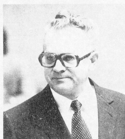
León Schlumpf Departamento de Transportes, de Comunicaciones y de la Energía

Al cierre de esta edición, hemos sabido que los Consejeros Federales Honegger y Hürlimann se retirarán de sus funciones a fin de este año.