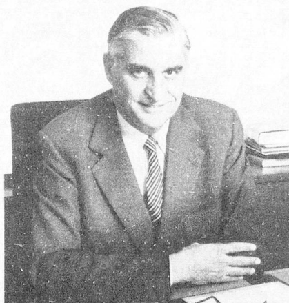
Fritz Honegger, Presidente de la Confederación Departamento de Economía Pública

Otras denominaciones: Gobierno (Nacional), Ejecutivo