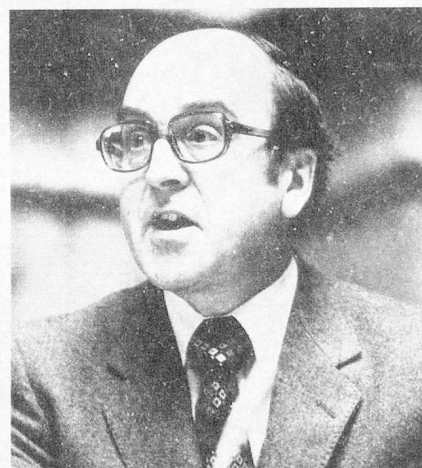
Kurt Furgler Departamento de Justicia y Policía