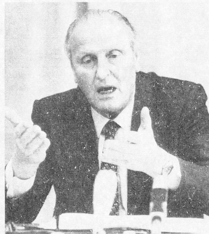
Willi Ritschard Departamento de Finanzas