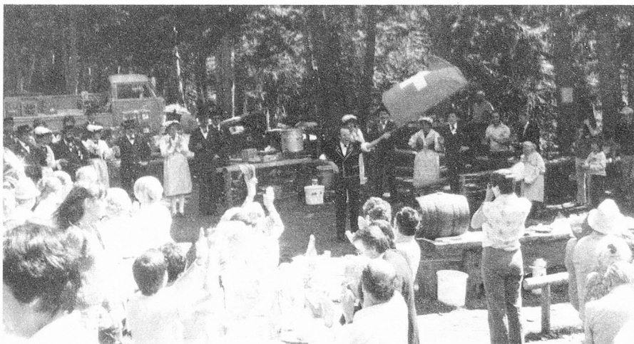
Un grupo folklórico anima la excursión del domingo.

La Comisión, finalmente, juzga importante y urgente, que la solución a que se aspira, sea adaptada ya ahora a la revisión que se encuentra en marcha, del derecho de nacionalidad.