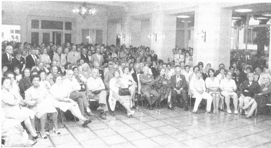
En la apertura oficial del Congreso.