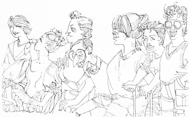
de groupe theatre connait un vif succès...