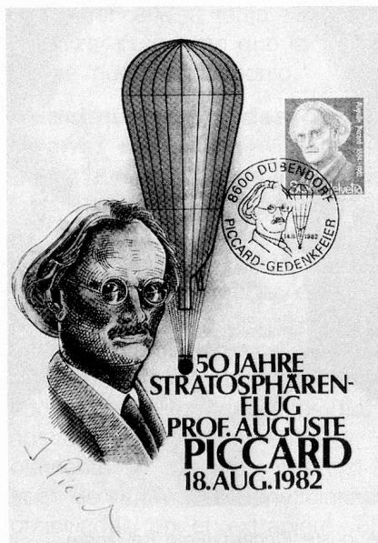
Sello de correo conmemorativo en honor de Auguste Piccard

to de 1932, Piccard repitió, en el aeropuerto de Dübendorf, su experimento, esta vez sin contratiempos. La aplicación del invento de Piccard no se hizo esperar. En 1940, nueve años después del primer ensayo, la compañía americana «TWA» inauguró un servicio con un avión Boeing Constellation, con cabina presurizada.