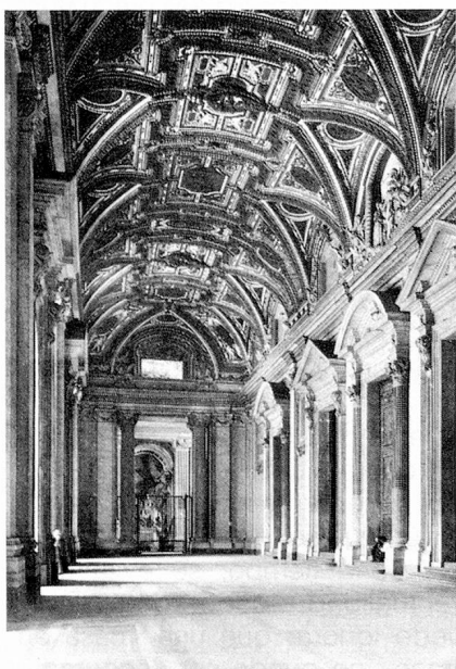
Entrada de la Basílica de San Pedro. La bóveda en estucos.

toli de Bedano, Simone Contini de Muggio y otros de menor renombre, para dar una idea de esta período excepcional. Sería fácil pero tedioso continuar con la enumeración, en Italia y en el mundo de las obras terminadas; es por eso que solo cita remos todavía a, Gaspere Fossati de Morcote, activo en Constantinopla, donde se dedicó a restaurar la iglesia de Santa Sofía, y para retornar a Italia a Giuseppe Frizzi de Minusio, quien edificó la mayoría de sus obras en Turín. Puedan estas breves indicaciones servirles de punto de partida para un acercamiento más detallado a esta larga y gloriosa tradición del Tesino un «país todo de maestros de obra...».