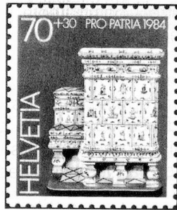
70 + 30 c. Musée grüerien, Bulle