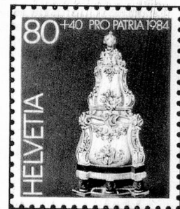
80 + 40 c. Museum Ariana, Genf Musée Ariana, Genève Museo Ariana, Ginevra