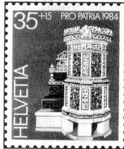
35 + 15 c. Landesmuseum, Zürich Musée nationale suisse, Zurich Museo nazionale svizzero, Zurigo

Este año, el producto de la venta del Don de la Fiesta Nacional es a favor de las obras de los suizos del extranjero. La primera colecta con el mismo objeto tuvo lugar en 1924, luego hubo otras similares cada seis o siete años. Los beneficiarios serán pues la Organización