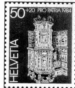
50 + 20 c. Freulerpalast, Näfels Palais Freuler, Näfels Palazzo (Freuler), Näfels