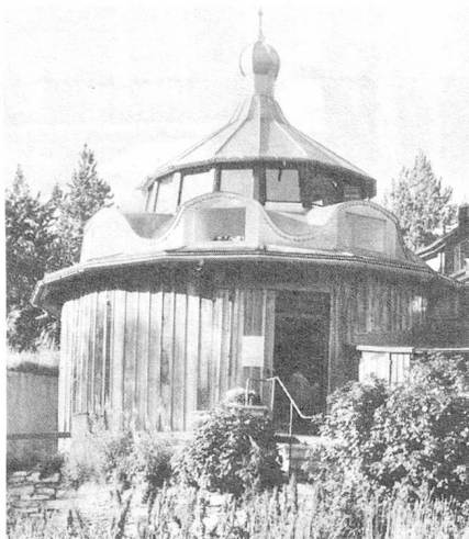
El Taller Segantini

Una de las obras más importantes de Giovanni Segantini (1858-1899) es el tríptico «La vida, la naturaleza y la muerte». Adquirida por la Fundación Gottfried Keller, de Zurich, se encuentra, desde 1908, en el Museo Segantini en Saint Moritz. Este tríptico fue un pedido hecho a Segantini para la Exposición Universal de 1900 en París. Con esta «sinfonía alpina, fiel reproducción de la naturaleza», ubicada en el Pabellón suizo, se esperaba promover el turismo naciente en la Alta Engadina. Pero razones financieras impidieron que ese ambicioso proyecto se realizara.