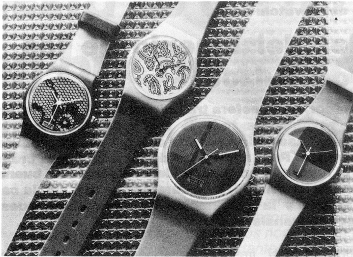
La colección Swatch otoño/invierno 1985-86