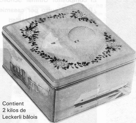
Contient 2 kilos de Leckerli bâlois

Dans les prix indiqués, tout est compris, soit les frais de port, l'emballage et l'assurance. Pour le paiement, veuillez joindre à la commande un chèque encaissable en Suisse ou effectuer le versement par poste, banque, ou solliciter vos amis helvétiques. Nous nous réjouissons de pouvoir vous adresser très bientôt un cordial bonjour de Bâle.