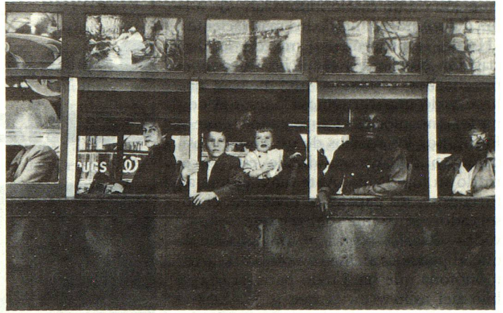
Robert Frank, Nueva Orleans, 1955-1956