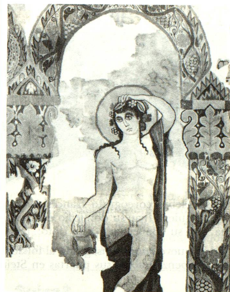
El dios del vino, personaje central del tapiz de Dionisio.

El análisis del estado de conservación y de la alteración de los colores permitió reconstituir íntegramente una de las más hermosas tapicerías de la época greco-romana. Esta representa una procesión dionisiaca, compuesta de ocho personajes