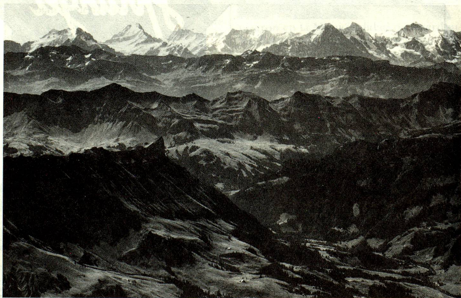
Las montañas suizas: una mayor atracción para el público. Esta vista aérea muestra las cadenas de montañas de los Prealpes y de los Alpes berneses. Arriba a la derecha, se ve el Eiger, el Mönch y el Jungfrau.

Después del canto de los poetas, la avalancha de turistas. Gracias a ellos, la región del Gothard se volvió rica pero dependiente. En Suiza, una persona en actividad sobre diez vive del turismo; en las regiones de montaña, que representan por cierto las dos terceras partes de nuestro país, hay mismo