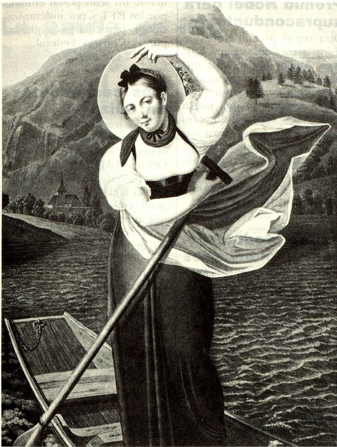
Las «lindas barque- ras» – atracción tu- rística del siglo XIX– eran jóvenes que, remando y can- tando, atravesaban el Lago de Brienz para conducir a los turis- tas a las cascadas del Giessbach.

una sobre tres. Desde St. Moritz hasta Montreux, la cuarta parte de los ingresos provienen del turismo.