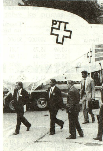
Los «oídos» del mundo: El Consejero Federal Ogi (al medio) delante la estación móvil de recepción de satélite en Naefels.