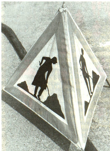
A trabajo igual, salario no siempre igual. (Montaje fotográfico: Lisa Schäublin)

Judith Stamm, que desde principio de año es presidente de la Comisión Federal para las cuestiones femeninas, es Consejera Nacional lucernense desde 1983 y miembro del partido demócrata cristiano (PDC). De 1971 a 1984 ocupó un escaño en el Gran Consejo del cantón de Lucerna. Nacida en 1934, Judith Stamm pasó su juventud en Zurich, donde terminó sus estudios de derecho con un doctorado. Durante varios años trabajó en la Policía cantonal de Lucerna siendo la primera mujer de Suiza nombrada oficial de policía. Actualmente es juez de menores.