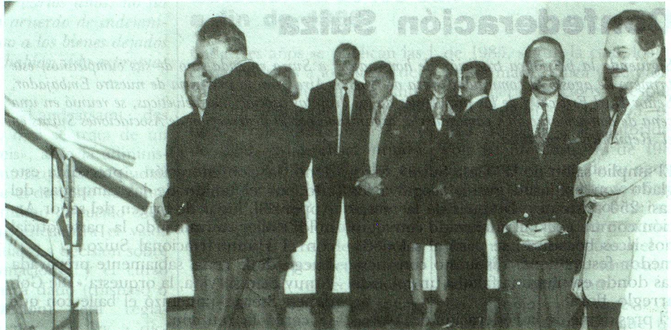
Acto inaugural de las nuevas oficinas de Swissair.

La modalidad de limitar el evento a un acto interno y austero fue acordada para permitir que el importe que hubiese insumido una ceremonia social de mayor despliegue se donara íntegramente a una institución benéfica argentina.