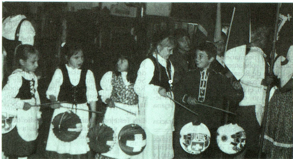
Niños ataviados con trajes típicos en el desfile de banderas y lampiones.