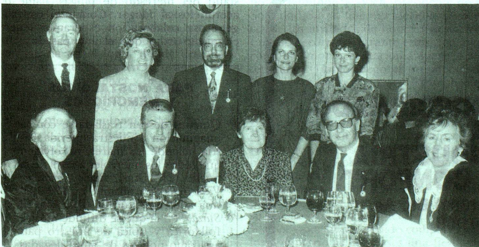
La mesa oficial presidida por el Señor Embajador