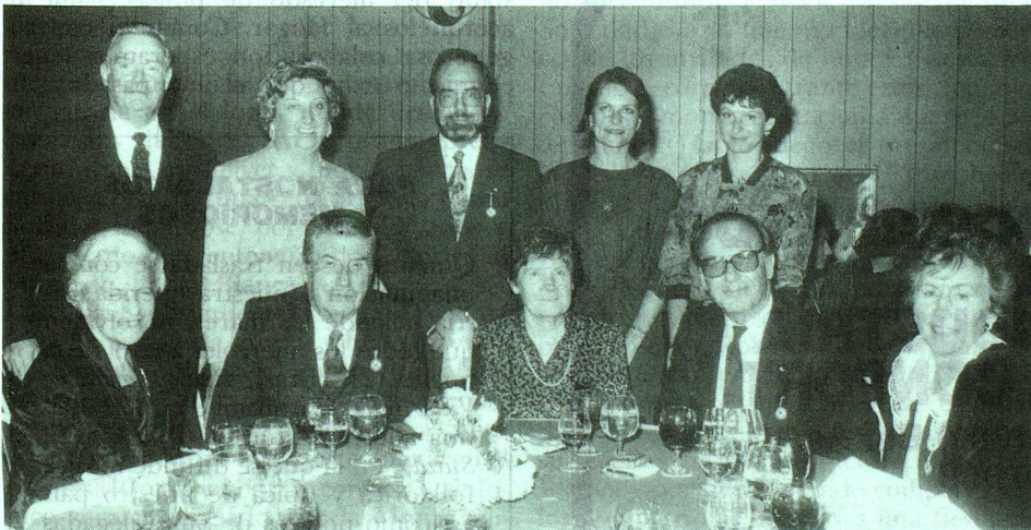
La mesa oficial presidida por el Señor Embajador