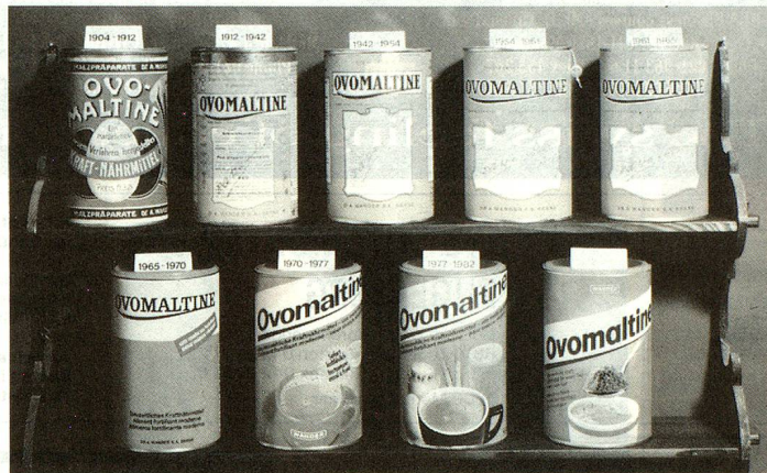
Envases de Ovomaltina de antes y de ahora. (Foto de archivo).

Para mucha gente, Wander, a justo título, es sinónimo de Ovomaltina. Este producto, compuesto de malta de cebada, leche, huevos, levadura y un poco de cacao (sin azúcar ni sustancias fibrosas) fue una de las primeras creaciones de Wander y triunfó en el mundo entero. Pero la Ovomaltina no nació simplemente de la idea genial de un día, sino que fue el fruto de muchos años de investigación y estudio de nuevos métodos. No obstante esta empresa, que en sus principios no ocupaba nada más que a dos per-