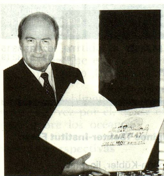
Joseph Blatter.

de las mujeres en la Iglesia Católica. Por otra parte, su nombramiento como Obispo Coadjutor en 1988 había sido ya vivamente discutido.