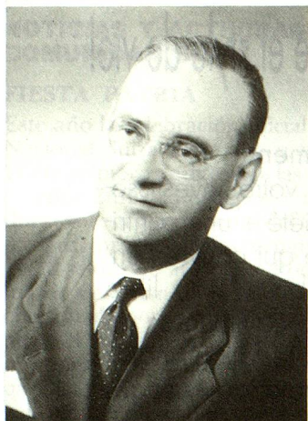
Carl Lutz.

En 1944, Carl Lutz, que entonces era Vicecónsul de Suiza y jefe de la División de la Protección en Budapest, logró salvar la vida de muchos miles de judíos húngaros gracias a un método genial. El próximo mes de diciembre será inaugurado en el centro de la capital húngara un monumento de bronce en su honor.