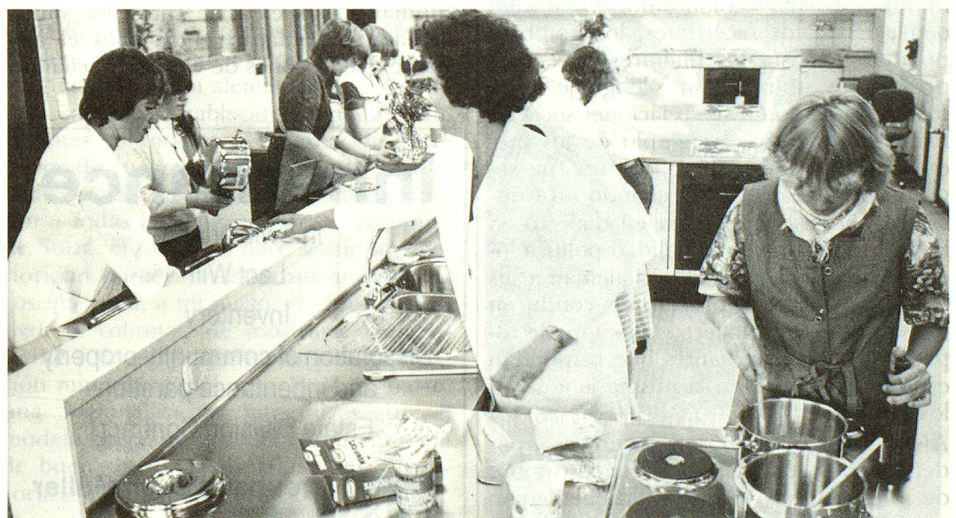
Durante ciertos aprendizajes, los profesores prefieren el dialecto al buen alemán, idioma escolar y «colonizador».

Un primer movimiento serio de reacción contra esa «colonización» cultural nació en Berna ya antes de la Primera Guerra Mundial, movimiento que pronto se extendió a toda la Suiza alemana después