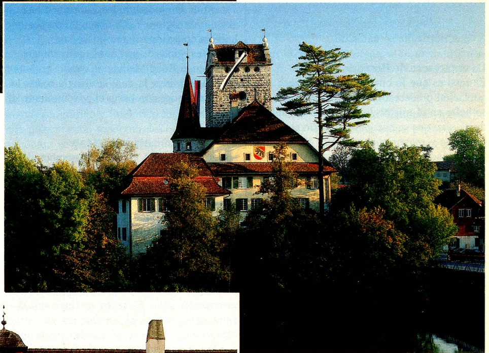
La «Visita Bernesa» consiste en ir a ver y conocer personalmente las capitales de distrito del cantón. La variedad de las Casas Consistoriales, ya se trate de castillo, monasterio, villa o palacio, refleja la riqueza histórica del Cantón de Berna. De arriba a abajo: Trachselwald, Aarwangen, Fraubrunnen; Meiringen, Berna (parte superior e inferior derechas).