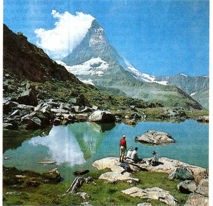
El Monte Cerviño como telón de fondo es nuestra mejor tarjeta de presentación

dencias secundarias que el propietario utiliza él mismo y las inversiones en trabajos de construcción y de equipamiento generados por el turismo, la demanda turística global en Suiza se sitúa entre 32 y 34 mil millones de francos.