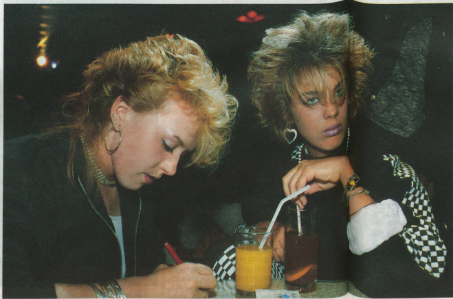
La dificultad de encontrarse a sí mismo: el consumo contra el tedio.

semana de anticipación. Por supuesto que siempre me sublevo contra tales cosas y aprendí a defenderme. Tal vez por eso mi hermana menor tiene menos dificultades. Lo que me fastidia de las personas mayores es que nos miren con cara rara en el tranvía cuando nuestra ropa