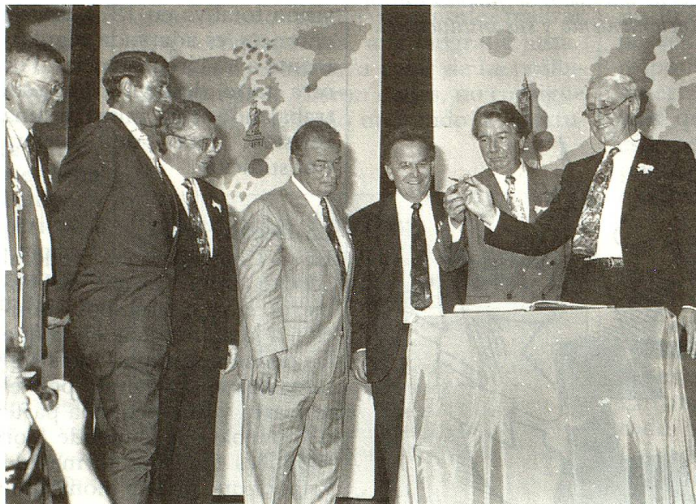
Todos los Consejeros Federales inscriben su nombre en el libro de visitantes.

Europa. Teniendo en cuenta las decisiones históricas que los suizos deberán tomar, instó a los suizos del extranjero a que hicieran uso sistemático de su nuevo derecho de voto por correspondencia y a dar el ejemplo a los ciudadanos residentes en el país con una gran participación.