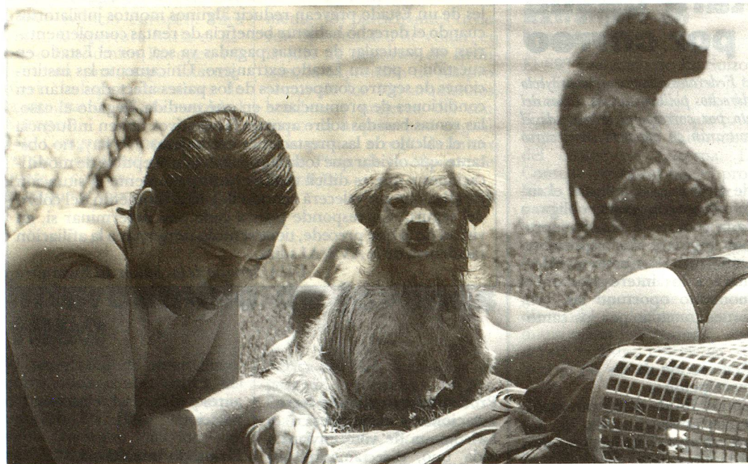
Todo el mundo lee con gusto «Panorama Suizo»...

Mientras que la sección mundial (páginas blancas) de la Revista Suiza tiene para todas partes el mismo contenido, las páginas regionales (verdes) son distintas según los países. En el siguiente cuadro puede verse qué países o continentes tienen sus propias páginas regionales y en qué idioma. Italia, el Liechtenstein y los Estados Unidos tienen no solamente sus propias informaciones locales sino también su propia revista: (1) «Gazetta Svizzera», (2) «Schweizer Bulletin» y (6) «Swiss American Review».