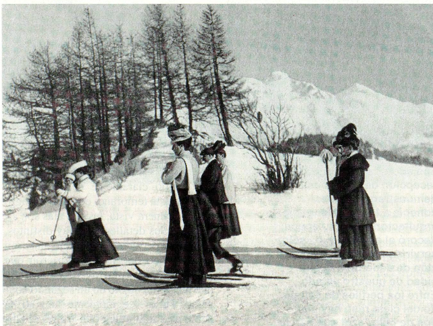
La Central Suiza de Transporte y Comunicación (CSTC) cumplió 75 años: esquiadoras de esa época.

● En una caverna ubicada debajo del Sustenpass, cantón de Berna, en la que la milicia deposita explosivos no reutilizables, estallaron entre 300 y 400 toneladas de explosivos. Las razones aún se desconocen. La caverna quedó enterrada bajo unos 50.000 m 3 de roca y escombros. El accidente causó la muerte de seis personas.