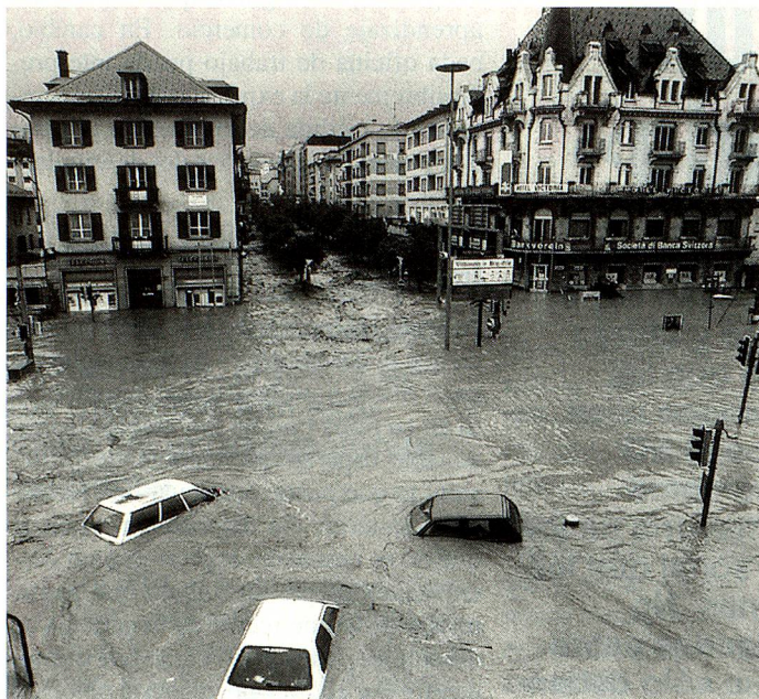
La tormenta que cayó sobre Brig tuvo consecuencias catastróficas.

Las torrenciales lluvias que cayeron durante varias semanas en diferentes regiones del país causaron daños considerables. En el Tesino se inundaron amplias zonas de Sopraceneri que tuvieron que ser declaradas en estado de emergencia. Las ciudades de Locarno y Ascona se inundaron cuando el lago Maggiore alcanzó niveles récord.