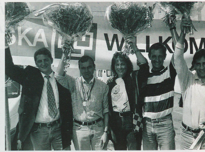
...y los jinetes.

para los deportistas profesionales. Sobre decir, que esto no alcanza para que los atletas puedan ser aún más profesionales. Un análisis ha demostrado que actualmente en Suiza las ventas relacionadas con el deporte ascienden a entre 16 y 18 billones de francos. ¡Ahora hasta está de moda ponerse zapatos tenis para andar en la ciudad! La influencia del deporte en la moda de tiempo libre es enorme; pero también en la hotelería, etc. Me parece justo que el comercio y la industria sigan contribuyendo para que podamos apoyar cada vez mejor al deporte, del que tan ampliamente se sirven para propagar sus servicios y productos.