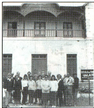
Valesanos de Esperanza delante del "Chateau" de la Sociedad Suiza Guillermo Tell donde funciona la Escuela.

Así fue como el domingo 31 de julio se realizaron diferentes actos conmemorativos, entre los que cabe destacar el homenaje que tuvo lugar frente al monumento del fundador de la ciudad, don Carlos Beck Bernard, ciudadano suizo de Basilea, cuya actuación al frente de la Sociedad de Colonización Suiza contribuyó al crecimiento de la colonia. Luego, en las instalaciones del Centro Comercial e Industrial, con la presencia de autoridades, connacionales y amigos, se interpretaron los himnos nacionales de ambos países, se escuchó la alocución del presidente de la Confederación Suiza, señor Otto Stich, y, posteriormente, el señor Jorge Risso y su grupo musical, ofreció un breve recital con temas suizos y del repertorio internacional.