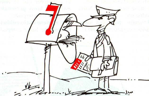
(Dibujo: Hugo Bossard)

En las oficinas del Servicio de los Suizos del Extranjero y del Secretariado de los Suizos del Extranjero seguimos recibiendo anuncios de cambio de dirección de las y los lectores de «Panorama Suizo». Los únicos responsables de la administración de dichos cambios de dirección son las representaciones suizas en el extranjero (Embajadas y Consulados suizos).