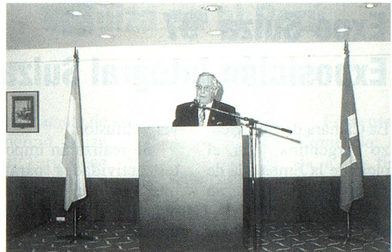
Señor Bieri durante su discurso