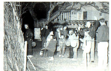
Grupo de niños frente a la fogata

El Club Suizo de Tigre fue escenario de la Fiesta dedicada a los niños suizos. Un simpático grupo de chicos participó iniciándose así en el sentimiento de arraigo a la patria de sus padres, que es también la propia.