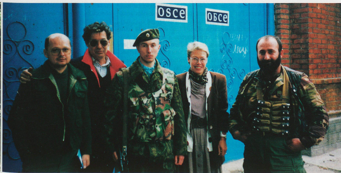
Heidi Tagliavini ante el portal de la Misión de la OSCE, junto con sus colegas de Polonia y Hungría, un oficial ruso (centro) y un guardaespaldas checheno.

Impresiones personales del comienzo de la misión de la OSCE en Chechenia