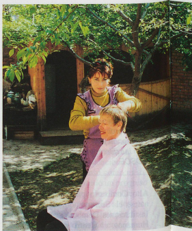
La «peluquería» en el patio de la Misión de la OSCE en Grosni.

Yo diría que sí. Las condiciones para llevar a cabo las elecciones fueron las garantías mínimas para ceñirse a los principios de la libertad, la corrección y la democracia acordados en el Tratado sobre la Paz. A Suiza como país presidente de la OSCE le correspondió decidir si se había cumplido o no con estos