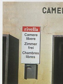
«Habitaciones libres», el turismo también sufre con la recesión y la alta tasa de cambio del franco.

De tal modo que la economía suiza se verá enfrentada a una interesantísima prueba de fuerza entre los conceptos de reglamentación y liberalización. ■