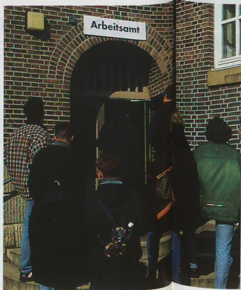
Jóvenes frente a la oficina de desempleo. Para la juventud el desempleo y la falta de puestos de aprendizaje son problemas apremiantes.

No obstante, estos incentivos son poco factibles en vista del ambiente bastante depresivo que se registra en las economías europeas. Durante el invierno pasado el cambio del franco siguió siendo demasiado alto y no bajó a un nivel normal sino en primavera. La exportación de empresas y puestos de trabajo al extranjero siguió desenfrenadamente, en parte debido a los costos y en parte porque Suiza no está integrada en la Unión Europea. A largo plazo, también es alarmante la merma masiva del mercado laboral en Alemania, porque Suiza