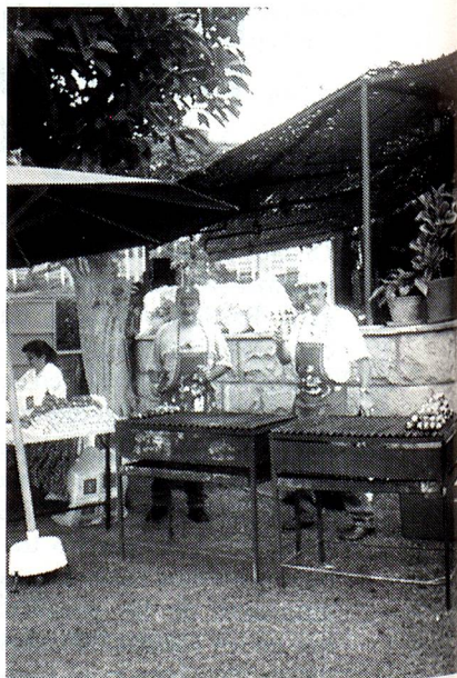
Presidente y Vicepresidente del Club a cargo de la Parrilla y ... Cerveza.