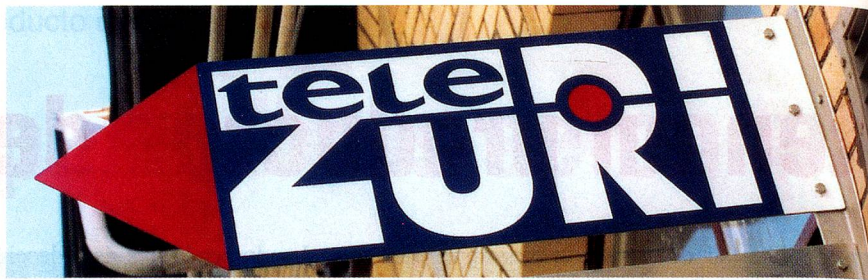
Desde hace poco las cadenas de TV privadas, tales como «teleZÜRICH» marcan el panorama.

Las fuentes de información empleadas por los consumidores son: publicaciones 50%, canal de televisión estatal