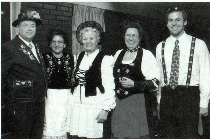
Grupo de asistentes con trajes de diferentes cantones

Con especial entusiasmo y alegría, el día 4 de Agosto se dieron cita en el Club Alemán de Temuco, suizos, descendientes y amigos para celebrar el 709° Aniversario de la querida patria Suiza.