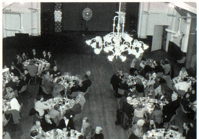
Vista del salón de la Sociedad Suiza de Baradero durante el almuerzo

CH-3000 Bern, 16 - Tel.: (0041) 31 351 61 00 - Fax: (0041) 31 351 61 50 e-mail: youth@aso.ch - Internet: http://www.aso.ch (información detallada sobre los módulos)