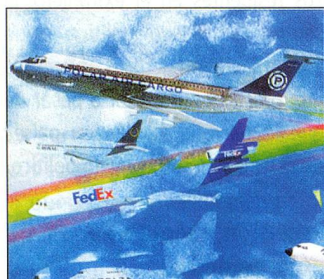
«Control Aéreo Insatisfactorio» PS 1/2000

Según los informes de los consumidores una de las razones más importantes de los retrasos en el tráfico aéreo europeo son los grandes espacios reservados en varios países por las fuerzas aéreas nacionales para el entrenamiento; Suiza es uno de estos países.