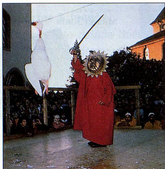
«¿Cómo Celebra Suiza?» PS 1/2000

Como ex habitante de Sursee, me veo obligada a corregir lo que escribieron los autores de las cartas publicadas en PS 3/2000. El ganso muere mucho antes de empezar el espectáculo. De tal manera que el público no se regocija con su martirio sino con la torpeza del enmascarado «ciego». Admito que esto puede ser de mal gusto. Lo que sí es de mal gusto es la comparación que hizo la Sra. Tucker con los linchamientos de los negros. ¿Será que en adelante debemos comparar la crianza de gallinas en jaulas con el holocausto? Pero dejemos eso, porque con ello no le ayudamos ni a los gansos ni a las gallinas y trivializamos la tortura diaria de seres humanos y el asesinato de otros así como suceden brutalmente en el mundo actual.