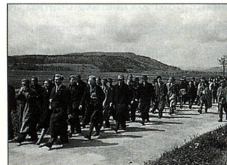
«Pasado Incriminado» PS 2/2000

Sentados cómodamente en el sillón frente a la TV nos resulta fácil juzgar una época en la que el 90% de nosotros no participó, mientras que los culpables ya fallecieron y ni siquiera pueden presentarnos su modo de ver las cosas. Además, los recuerdos de los ancianos que forman el 10% restantes entre tanto han perdido su nitidez. Tampoco creo que el gobierno suizo que de facto y en base a la neutralidad se encontró en una posición bastante ventajosa, se haya hecho culpable de alguna manera según sostiene el autor del artículo.