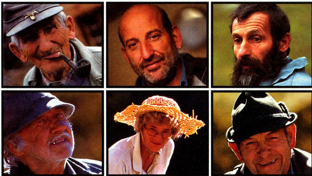
La gente parece tallada de madera.

La disolución de los monopolios estatales de los servicios públicos dificulta la situación de las regiones remotas. En nuestras diferentes regiones idiomáticas hay preocupación y apuros pero también surgen medidas innovadoras contra la amenaza de suspender la cobertura completa de los servicios básicos.