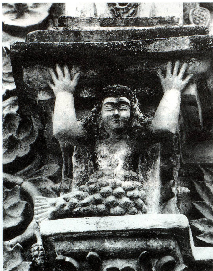
Imagen de una ninfa tallada sobre piedra. Tilaco, México (foto tomada en 1993)

La visión fotográfica de Madeline vuelve a plantear el antiguo debate del universalismo y relativismo; el basamento de la pirámide de Santa Cecilia en el Estado de México, otro de una casa campesina en Suiza y otro más en España. Una lectura rápida puede dar un pensamiento compartido