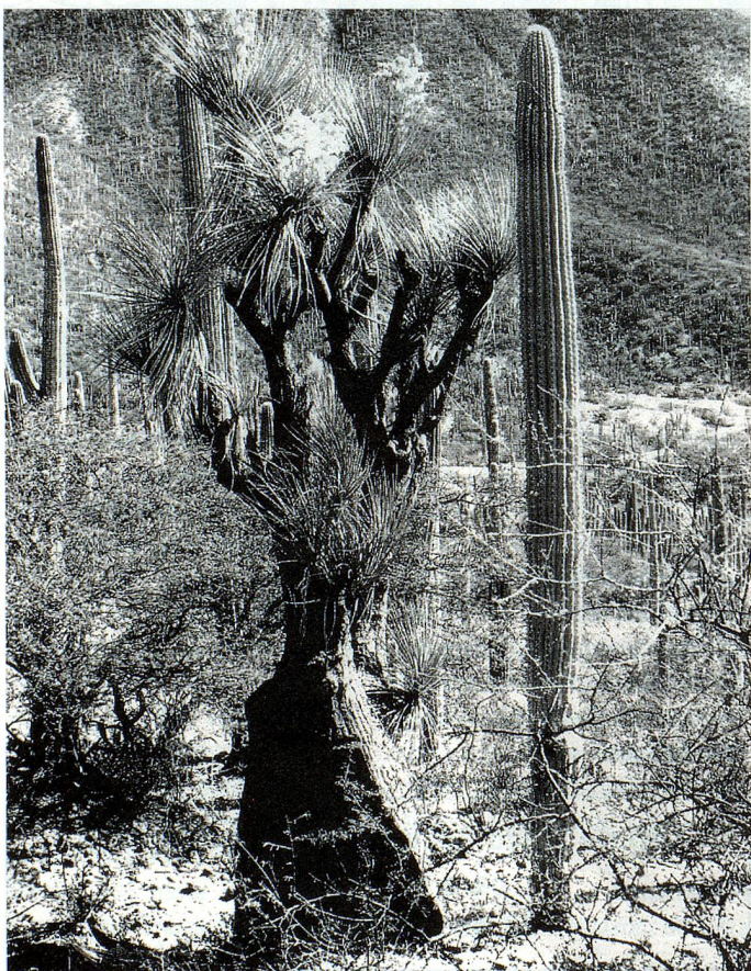
Flor de yuca de Zapotitlán Salinas en contraste con la estructura vegetal de una catácea. (foto tomada en 1994 México)

Madeline Mollet es una narradora de formas y viajes, capaz de transmitirnos la alegría de un fantástico sol, que resalta sobre el claroscuro y nos lleva a un mundo modelado, complejo y diverso de vegetales caprichosos y formas ordenadoras, que sin embargo, nos deja una historia sin dirección, solo los hechos naturales y humanos, de otra contemporaneidad.