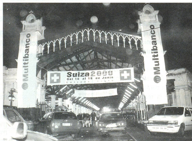
Vista panorámica de los galpones de la estación.

En el stand de la Embajada, los interesados han podido recibir informaciones y documentación sobre nuestro país. Por su parte, la ONG Suiza Helvetas han hecho conocer sus proyectos de cooperación en el Paraguay.