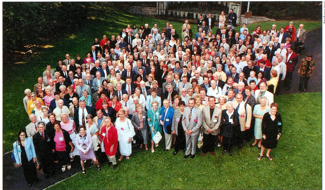
Radiantes miembros del CSE frente al Centro de Congresos de Davos.