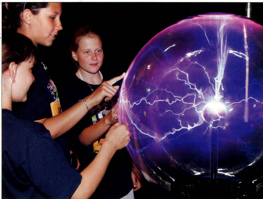
Hay que fomentar la Plaza Suiza de Ideas. Foto de jóvenes en el Technorama Winterthur.

A pesar de estar de acuerdo todos los partidos en adjudicar más medios a los sectores de estudios e investigación, el problema de su financiación divide las opiniones. Mien-