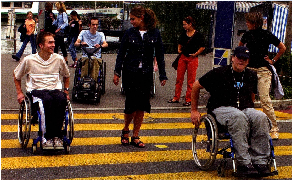
Centro Suizo de Paraplégicos, Nottwil

Las medidas de integración deben mejorar sustancial y permanentemente.