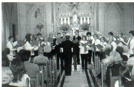
Concierto en "Nuestra Sra. de la Misericordia" de Flores.