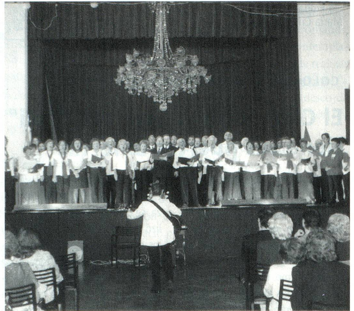
Cierre del I Encuentro Coral organizado por el Coro Suizo de Bs.As.