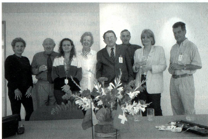
Firma del Acta Constitutiva de la Fundación Espacio Suizo (12 de febrero de 2004)

Luego del éxito alcanzado con el ambicioso proyecto Impacto Suizo realizado en marzo de 2002 entre la Embajada de Suiza en Venezuela y la Cámara Venezolano-Suiza de Comercio e Industria, en las ciudades de Caracas y Maracaibo, con eventos en el ámbito económico-comercial, académico, cultural y gastronómico, surgió la idea de mantener en Venezuela la imagen de Suiza como país multicultural y polifacético con grandes aportes en las áreas antes mencionadas.