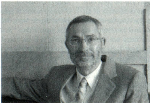
Embajador de Suiza en el Perú, Sr. Beat Loeliger

El 22 de abril de 2004 se realizó el "Reencuentro de los Suizos de la Tercera Edad" en la residencia del Embajador de Suiza en el Perú, Sr. Beat Loeliger. El evento fue